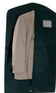
2898 – La Housse pour costume avec pochette pour chemise