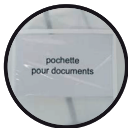
1441 – La Classique non-tissé, avec petite fenêtre et pochette à documents