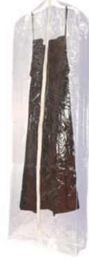
1750 la chiara completamente trasparente