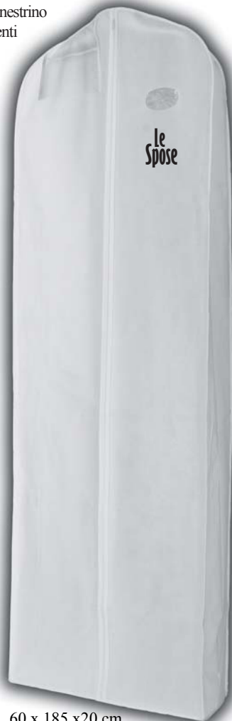
60 x 185 x 20 cm (per tutti gli articoli tranne 2898)

Le nostre cuffie protezione-trucco sono la soluzione giusta per evitare residui del make-up. Sciarpe e fazzoletti non offrono una protezione sufficiente e sono spesso rifiutati dalle clienti per motivi igienici.