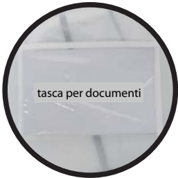
1441 la classica tessuto non tessuto, con finestrino e tasca porta documenti