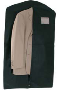
2898 la custodia per costumi con tasca porta camicia 65x110x6 cm