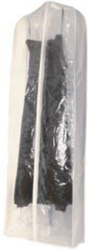
4691 la nuova fronte trasparente/dietro tessuto non tessuto con tasca porta documenti

Le nostre custodie per abiti da sposa sono un mezzo di lavoro irrinunciabile nella vendita al dettaglio, sia per presentare gli abiti da sposa che per proteggerle durante il trasporto o dagli sguardi curiosi. Personalizzate con il vostro marchio, le nostre custodie sono perfette per la vostra promozione.